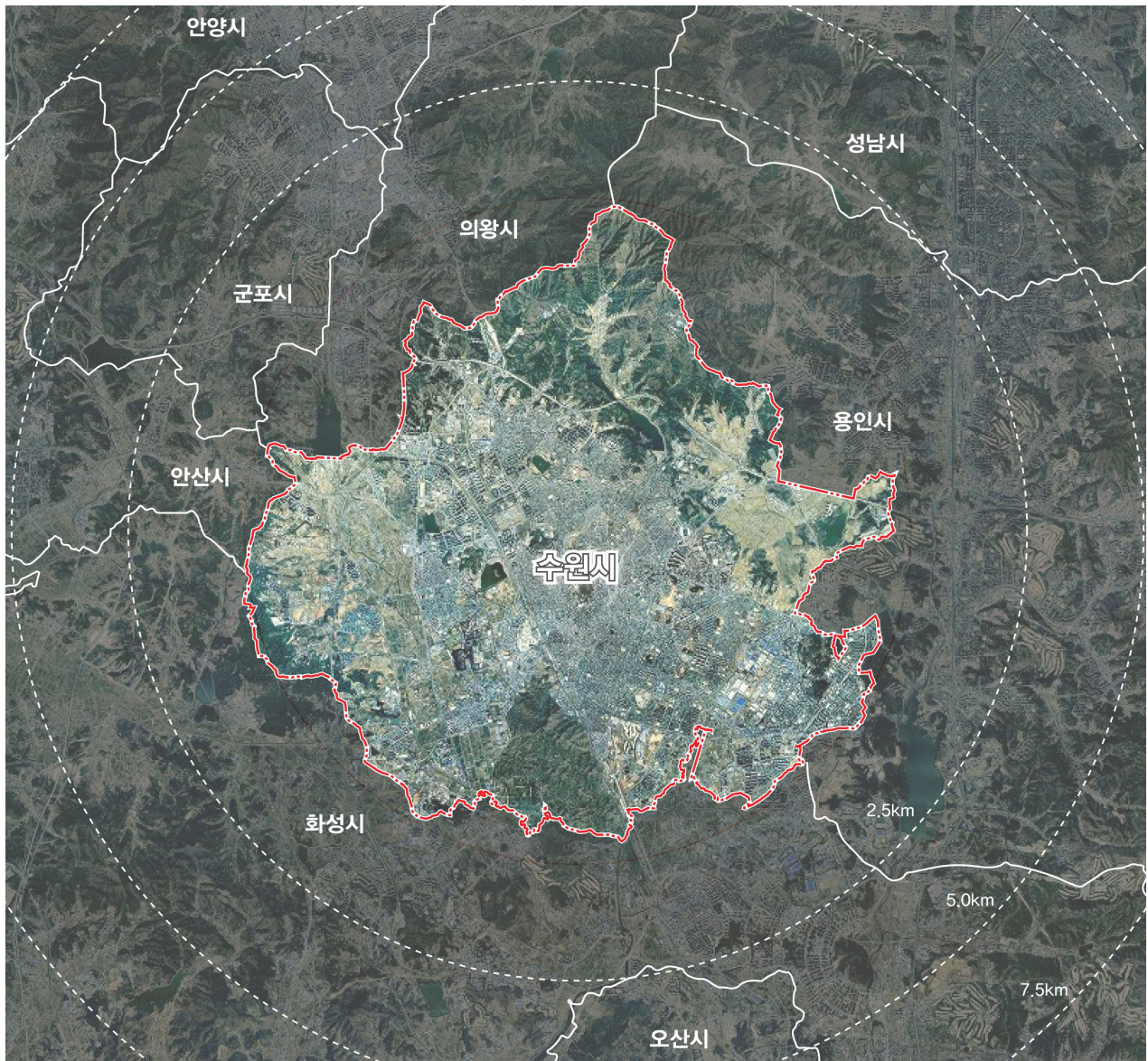
<그림 1-1> 수원시 위치도